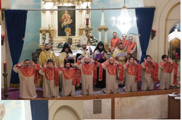
Deacons receiving God's blessings during the ordination.