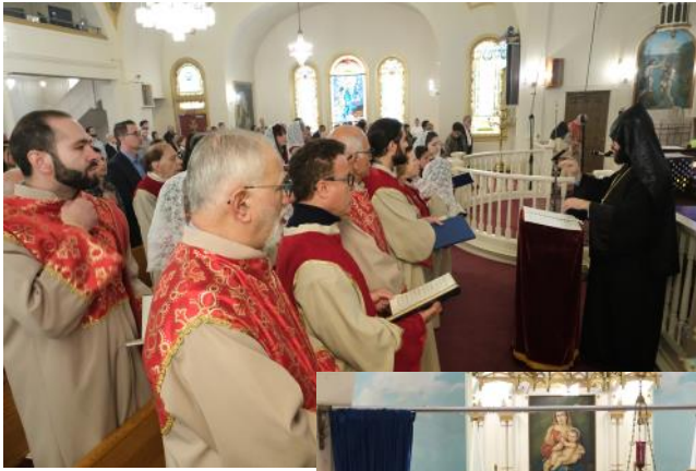
The Holy Trinity Armenian Apostolic Church Choir performing at the Deacon Ordination that took place on Sunday, November 6, 2022